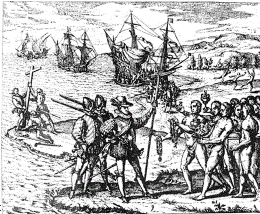
Figura 2. Grabado de Theodoro Bry de 1591 sobre la llegada de Colón a Indias en 1492

Las entradas a nuevas tierras eran realizadas en huestes organizadas que actuaban en nombre de la Corona y a su servicio. Solían estar compuestas por un reducido número de hombres armados, sin milicias profesionales, gran parte de ellos segundones de la nobleza, hijosdalgo o caballeros, soldados de procedencia dudosa, aunque en minoría había religiosos, y siempre iban los “oficiales reales”, encargados de vigilar los intereses de la real hacienda, acompañados de numerosos indígenas porteadores, guías, intérpretes o espías 4 . Establecidas las huestes, avanzaban con la finalidad de dominar las poblaciones aborígenes que encontraban a su paso, unas veces pueblos cazadores-recolectores de precario desarrollo cultural, y otras, verdaderos imperios militaristas que contaban con ejércitos profesionales, sin llegar a ser éstos últimos un freno a sus desmedidas ansias conquistadoras, ya que estas últimas regiones fueron dominadas con mayor rapidez. En su lucha contra los infieles, los castellanos pretendieron que reconocieran la soberanía del rey de España y, como portadores de una misión mesiánica, convertirlos a la verdadera fe católica, en definitiva, que aceptaran la cultura europea considerada la de más alta civilización.