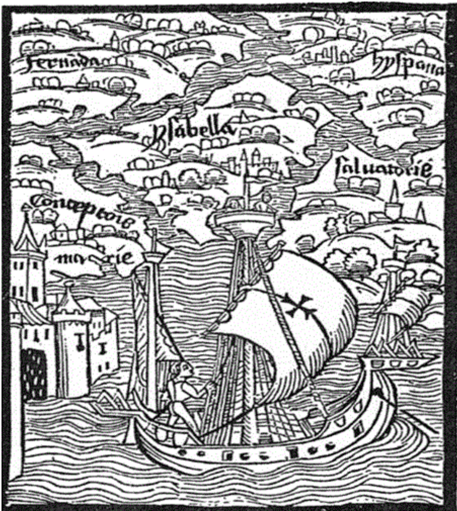
Figura 1. Grabado europeo sobre la llegada de Colón a las islas del Caribe. Ilustra la carta que el descubridor escribió a los reyes católicos a su regreso. En latín (Basilea, 1493), 11x7.5 cm.