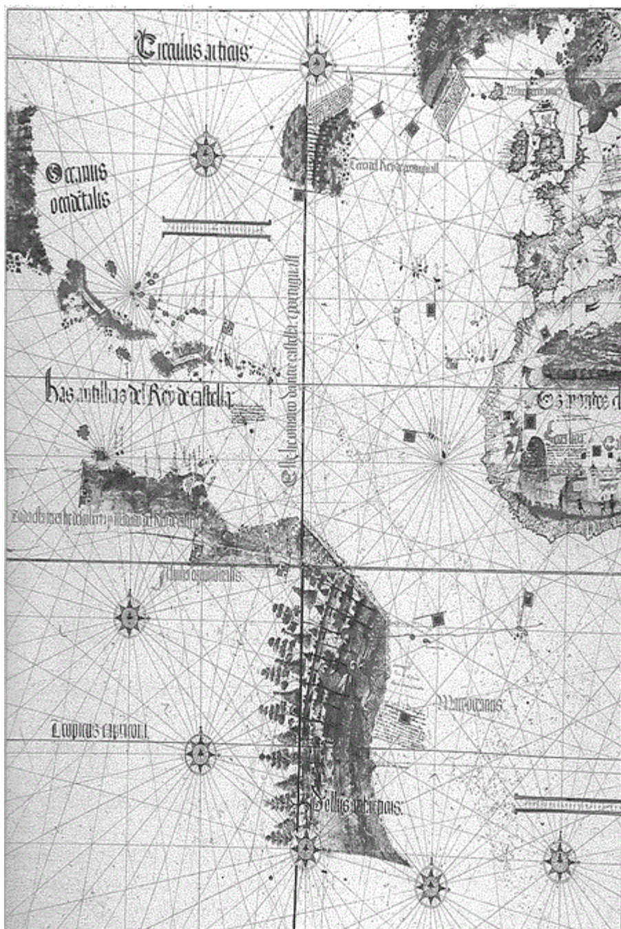
Figura 3. Fragmento del planisferio de Cantino (1502), portulano portugués anónimo, en pergamino coloreado con todas las tierras conocidas. En él se pueden apreciar los contornos de las costas brasileñas, con gran precisión para el momento de su realización; el paisaje de bosque frondoso y verde, en el que hay tres papagayos (se llegó a llamar Tierra de los Papagayos entre los marinos); y la línea establecida por el Tratado de Tordesillas que atraviesa Brasil de norte a sur